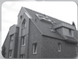
Klempner- und Fassadenarbeiten